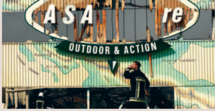
■ 28 april 2004: uitbrand na een blikseminslag.