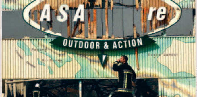
■ 28 april 2004: uitbrand na een blikseminslag.